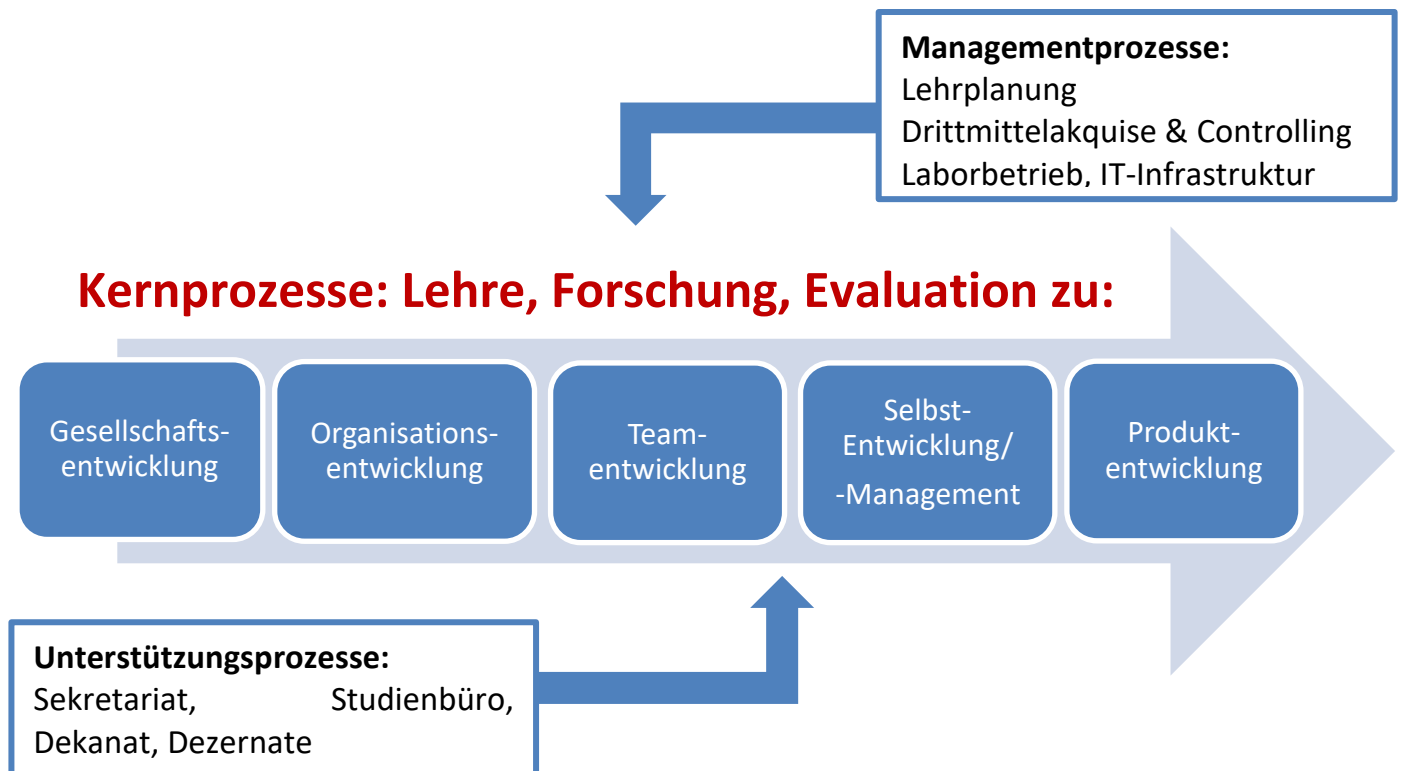
Abbildung 2. FAI-Kernforschungs- und Lehrgebiete mit den zugehörigen Unterstützungs- und Managementprozessen